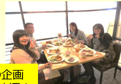
バーベキュー等の企画で、オフでの交流を深め、仲間を増やす