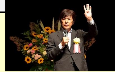
教育シンポジウム

齋藤孝氏（教育学者） 高田明氏（ジャパネットタカタ創業者） 竹田双雲氏（書道家） 宮本亜門氏（演出家） 小野田正利氏（教育学者） 村川雅弘氏（教育学者）