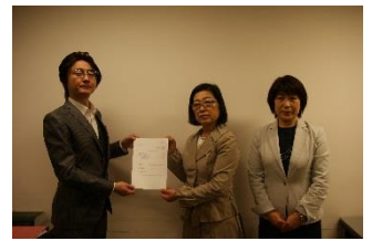
文部科学省に要望書を手渡す全日教連養護教諭部員

子供達がより安心・安全に学校生活を送れるために、 岐学組は、引き続きあなたの支えを必要としています。 30年度もよろしくお願いいたします。